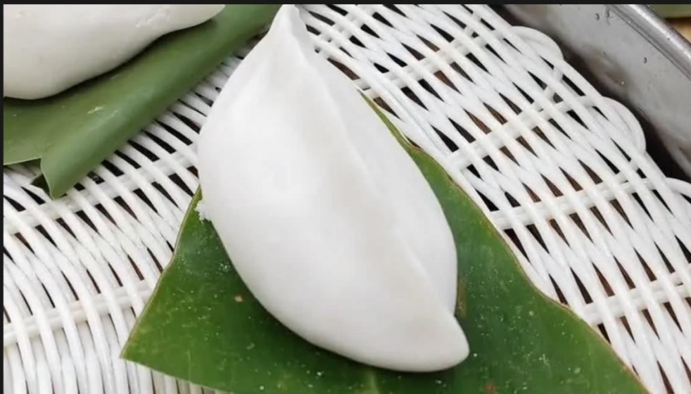
Fig. 3.1.8 One article and encoding request on WeChat Official Account

所以现在各种媒体在提到米jiǎn的时候，就把它直接写成了米饺。字虽然简单了，但是意思也完全变了！