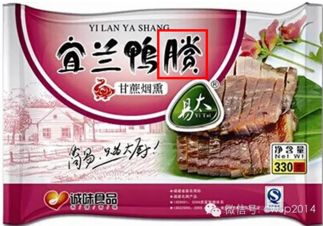
Fig. 3.3.1 Product shown on WeChat Official Account

This product was once sold in Chinese Min-nan dialects and Puxian dialects area of Fujian Province, such as Xiamen City (厦门市), Zhangzhou City (漳州市), Quanzhou City (泉州市), Putian City (莆田市) and so on, but this one is no longer sold. The article shown in the WeChat link under this picture shows one restaurant in the tourist scenic spot near the sea and the bay in Xiamen City, but the restaurant has been closed based on 大众点评, and the tourist scenic spot still opens to the public.