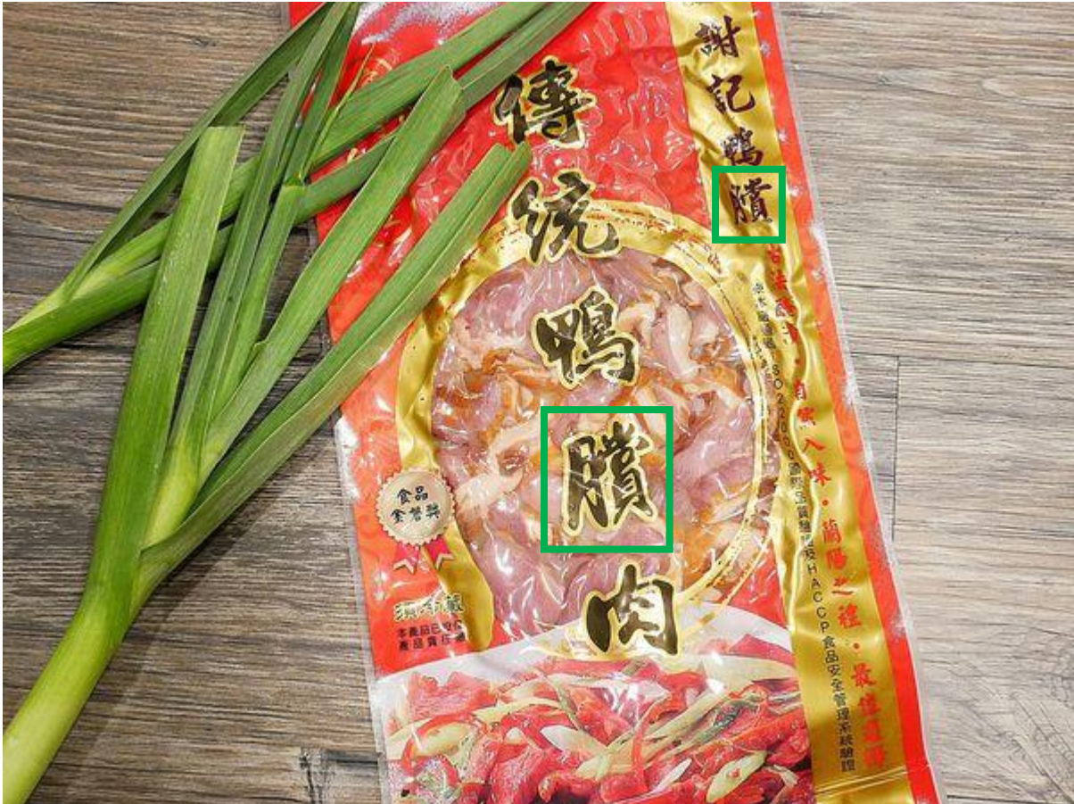
Fig. 3.2.4 Product shown on WalkerLand

品名：去骨鴨臘 內容物：土番鴨、D-山梨醇液、食鹽、L-麩酸鈉、乳酸鈉液、蔗糖、葡萄糖、香料、胺基乙酸、琥珀酸二鈉、5'-次黃嘌呤核苷酸二鈉、5'-鳥嘌呤核苷酸二鈉、DL-胺基丙酸、檸檬酸鈉、L-天門冬酸鈉、麥芽糊精、白菜抽出物、水解大豆蛋白、紅蘿蔔抽出物、多磷酸鈉、偏磷酸鉀、異抗壞血酸鈉(抗氧化劑)、亞酸鈉(保色劑)、己硝二烯酸鉀(防腐劑)、當歸、川芎、枸杞、肉桂、二氧化矽、鹿角菜膠、氯化鉀、蒟蒻、刺梧桐膠、丁香、五加皮、小茴、山奈、天然燻料(甘蔗)。 淨重：600公克±15公克 有效日期：標示於封口