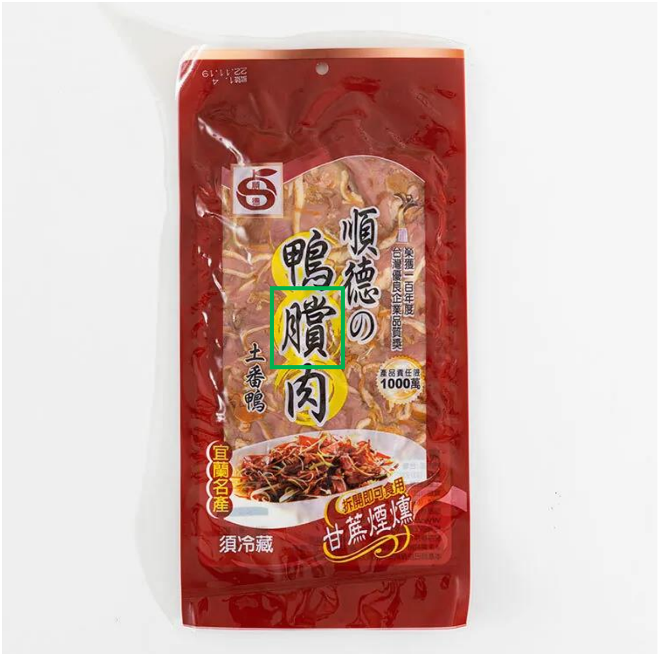
Fig. 3.2.8 Product shown on 喜互惠 e 直購