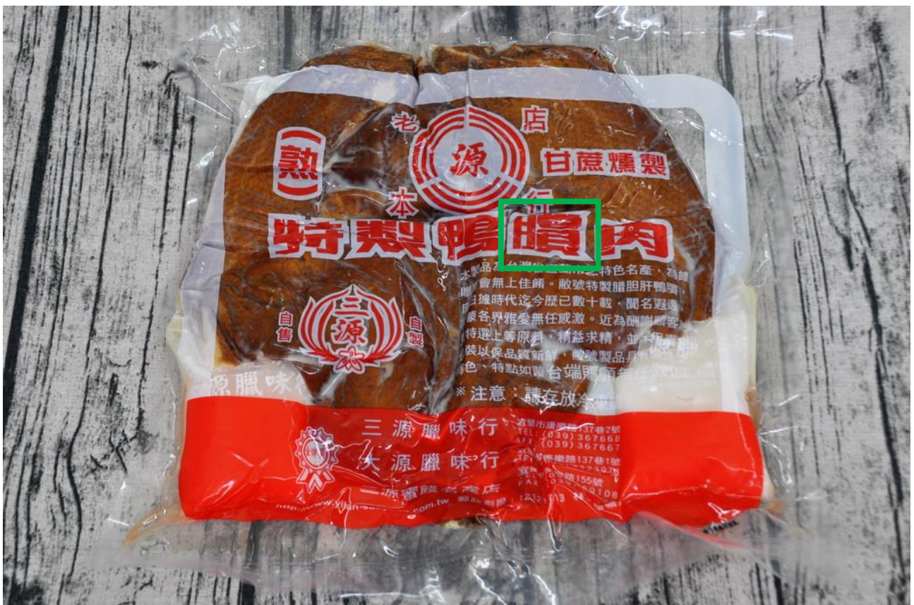
Fig. 3.2.18 Product shown on 三源臘味行