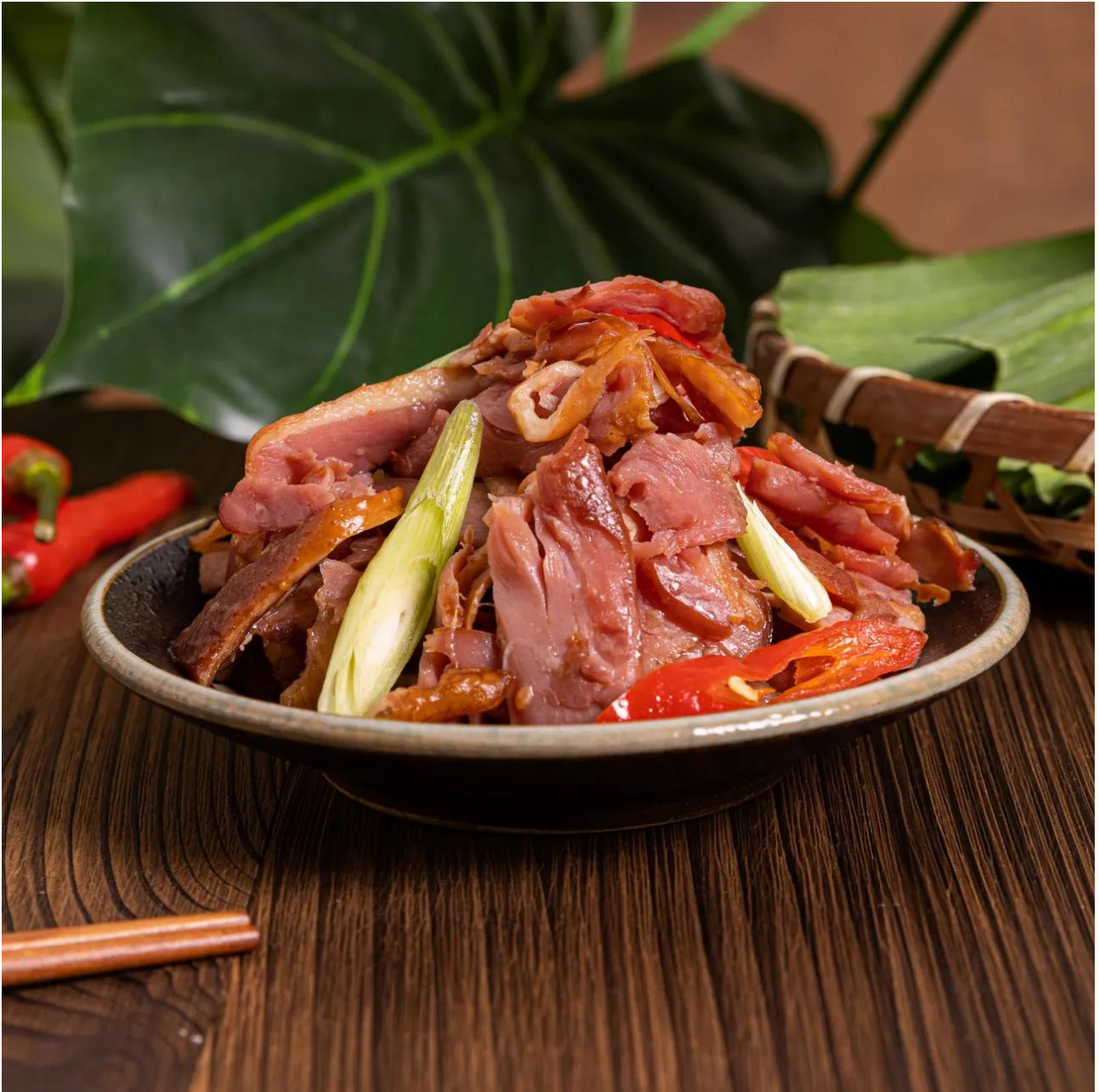
Fig. 2.4 “鴨臄”

Now it has been developed for more cooking methods. TVB (Hong Kong SAR) produced (or translated and re-produced) a documentary to record it and provided the Cantonese reading. The third character is the simplified form of the second one, which is used in the same kind of product in Chinese Min-nan dialects and Puxian dialects area of Fujian Province.