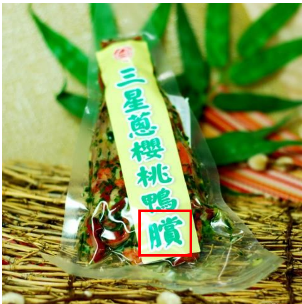
Fig. 3.2.12 Product shown on 東昌鴨臠