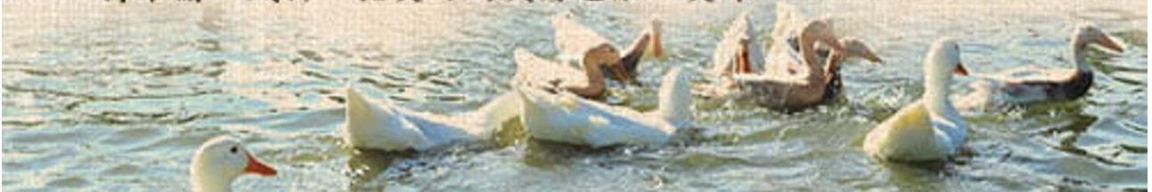
Fig. 3.2.20 A product advertisement

一路走來，謝記古味手法是我們最堅持的祕寶。 古人的智慧總有他的道理，養生要先養身，現代人講求低糖、低鹽、零負擔的健康飲食觀念。 謝記鴨賞是採用正統土番鴨，以獨家香料醃漬，自然入味， 並以炭火上覆蓋甘蔗煙燻而成，甘甜的香氛、全然滲入鴨肉裡頭， 製造過程費時、費工，每一個步驟，都精心專業，堅持不偷工減料，把美好的歲月也融入美味。