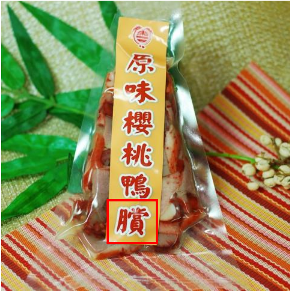
Fig. 3.2.15 Product shown on 東昌鴨臘