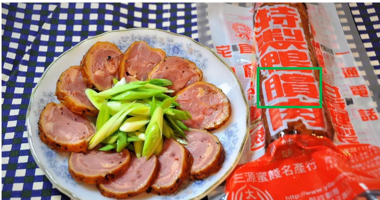
Fig. 3.2.16 News report on 好視新聞