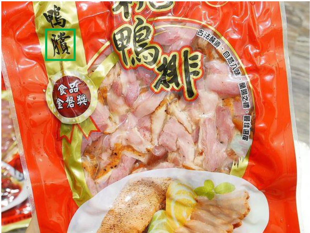
Fig. 3.2.2 Product shown on WalkerLand