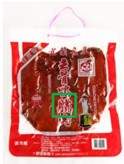
Fig. 3.2.7 Product shown on the official website of Shun De Salted and Dried Meat Food Factory