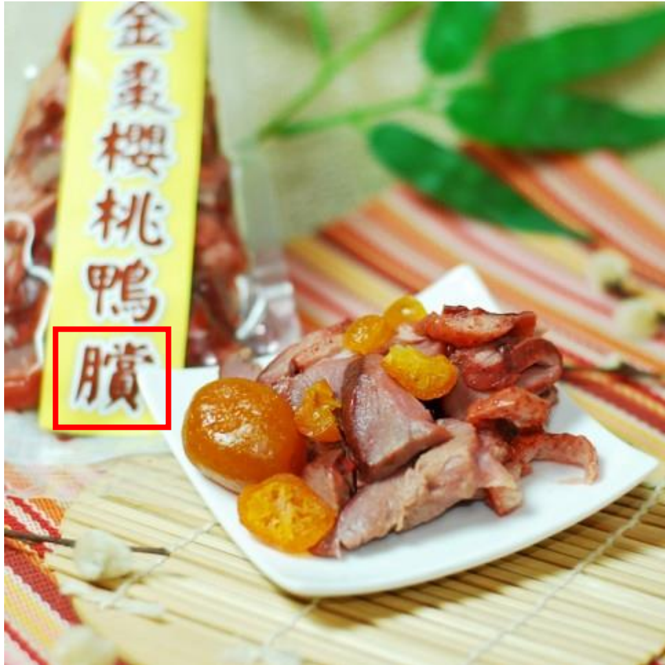
Fig. 3.2.14 Product shown on 東昌鴨臄