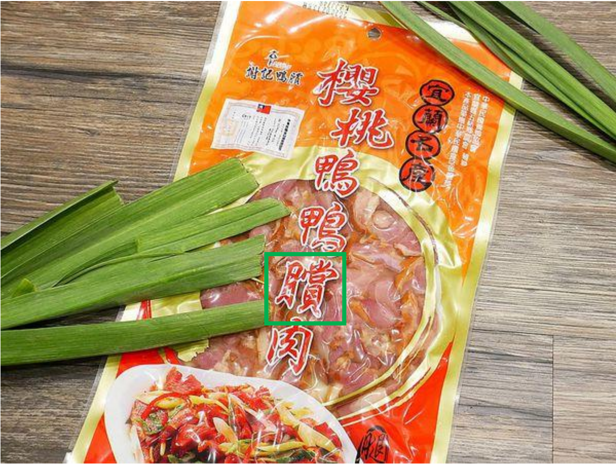
Fig. 3.2.1 Product shown on WalkerLand