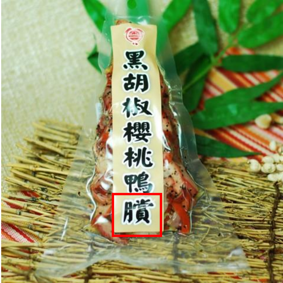
Fig. 3.2.13 Product shown on 東昌鴨臄