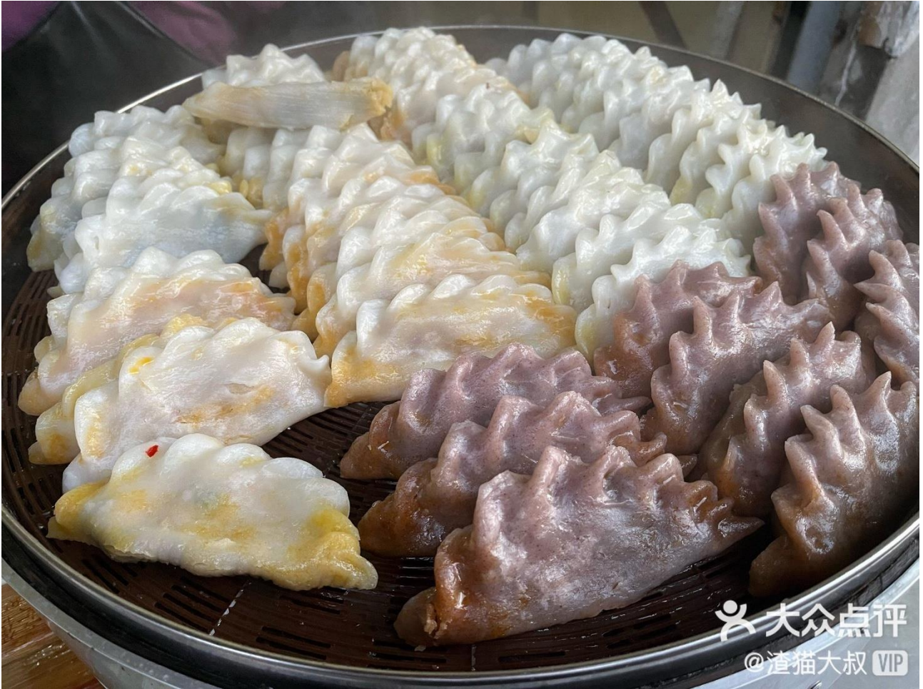
Fig. 2.3 米饺 sold on the shop 红霞米饺 in Dongzhi County

For the second submitted character, in Yilan County, the local people eat one kind of smoked duck product mainly in Mid-Autumn Festival and Chinese New Year celebration. In the end of 19th century, the local people tried to smoke and roast marinated duck with sugarcane skin in kitchen range, because Yilan is a rainy place, and it is hard to roast duck by sunlight. The most traditional form was to use Peking duck (北京鸭, not Beijing Roast Duck/北京烤鸭). This kind of food was more and more popular in Yilan, and other producers also used cherry duck (樱桃鸭) and other local duck (土番鸭) later. Duck was very precious at that time, so they use the ideograph “赏” (“award”) to name this kind of food as “鸭赏” (ah-siúnn). Based on one news report on The Hub News, the ideograph “贖” was firstly used by one important producer after 1899, which is the variant of “赏” and only used for this kind of food. Please see the following picture.