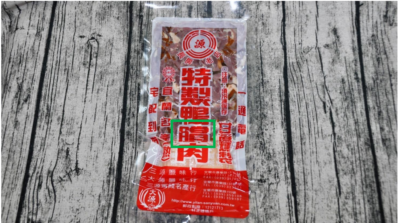
Fig. 3.2.17 Product shown on 三源臘味行