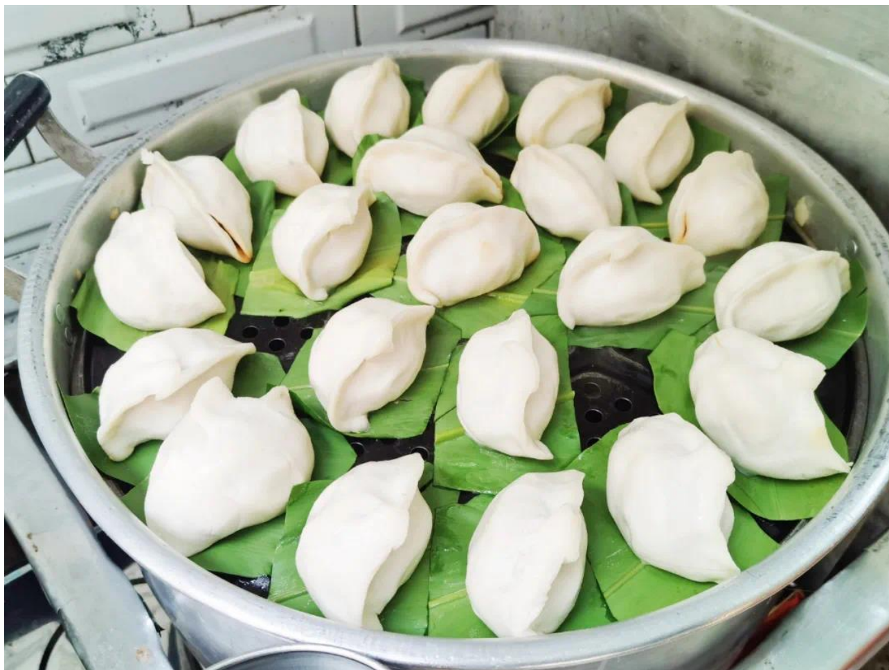
Fig. 2.1 This kind of rice product shown on WeChat Official Account

For the first submitted character, in Xiapu County and its neighboring Zherong County (柘荣县), the local people eat one kind of rice product with the half-moon shape (半月形) in winter solstice, which is called as 米糰. The skin is made of glutinous rice (糯米), and the main stuffing is shredded radish (萝卜丝). This kind of food needs to be steamed underneath leaf of a kind of Alpinia (艳山姜). Now a variety of flavors have been developed. Please see the picture below.