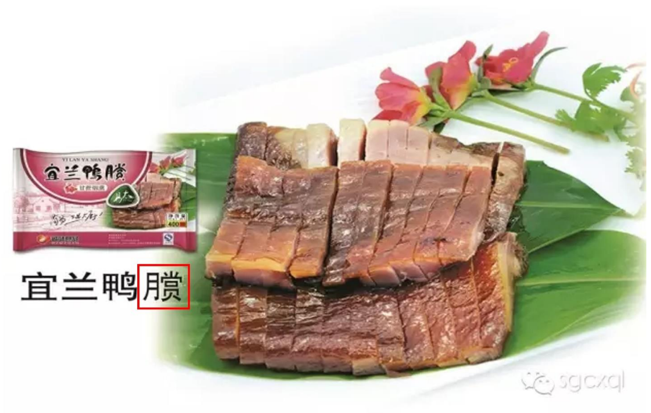
Fig. 3.3.2 Product shown on WeChat Official Account