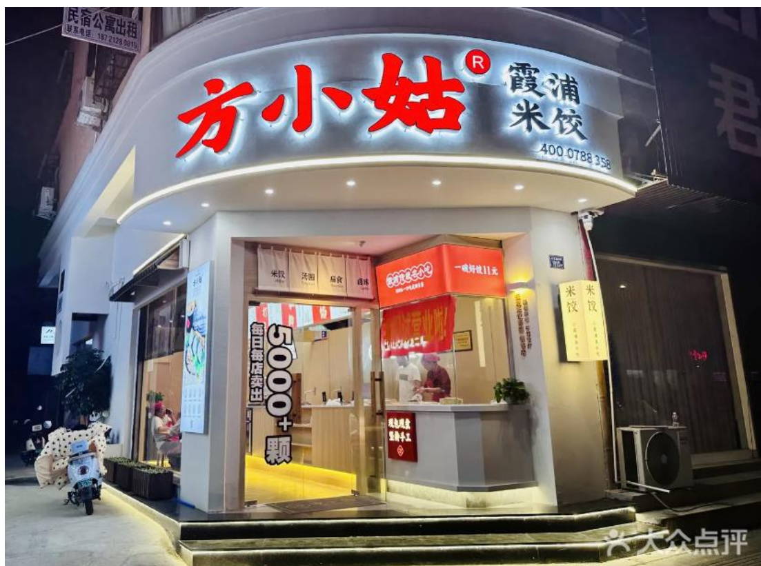
Fig. 2.2 方小姑（东吾路店） in Xiapu County

On the other hand, “米饺” means a kind of Chinese dumpling ( jiaozi ) literally, such as the dumpling in Dongzhi County, Chizhou City, Anhui Province (安徽省池州市东至县), which has been registered as DB3417/T 015—2022 (《池州特色小吃 东至米饺》). The skin is made of polished indica rice (籼米), not glutinous rice; the main stuffings are not only shredded radish, but also green bean (豆角) and so on; the shape is very similar to the common Chinese dumpling, not the half-moon shape; and there is no any kind of underneath leaf. It is not better to treat them the same to make them confused. One more interesting thing is that 东至 reads the same of 冬至 (winter solstice) in Putonghua and so many other Chinese dialects. The following picture shows the dumplings in Dongzhi County.