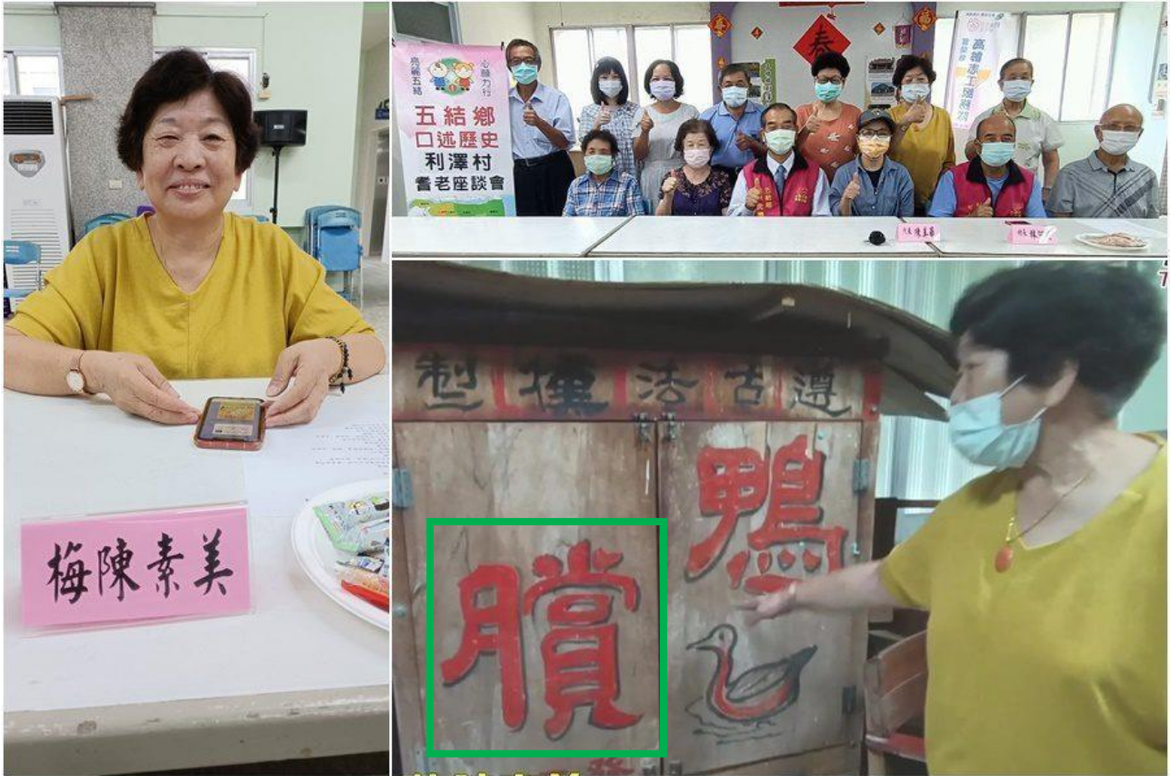
Fig. 3.2.19 New report on the Hub News