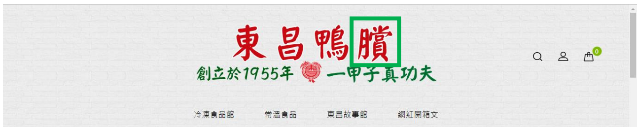
Fig. 3.2.10 Heading of the home page on 東昌鴨臘