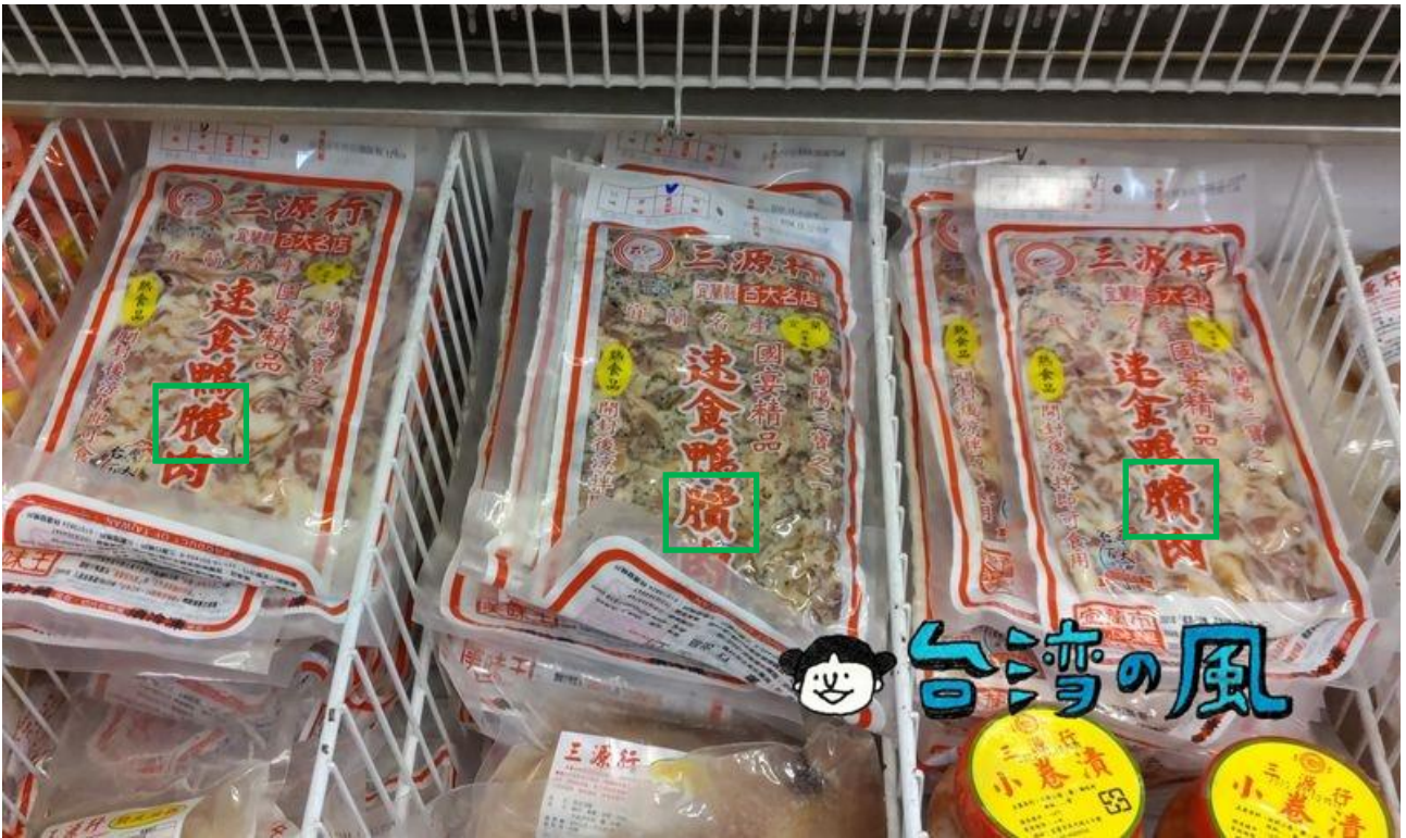
Fig. 3.2.6 Product shown on 台湾の風